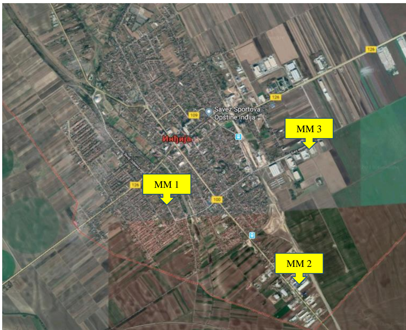
Slika 1. Makrolokacija naseljenog mesta Inđija sa označenim mernim mestima