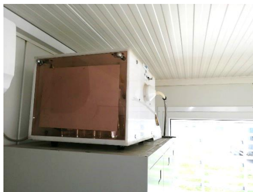
Slika 5. Merno mesto MM 2