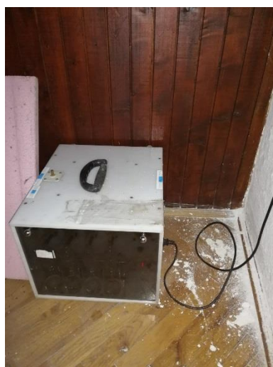
Slika 3. Merno mesto MM 1