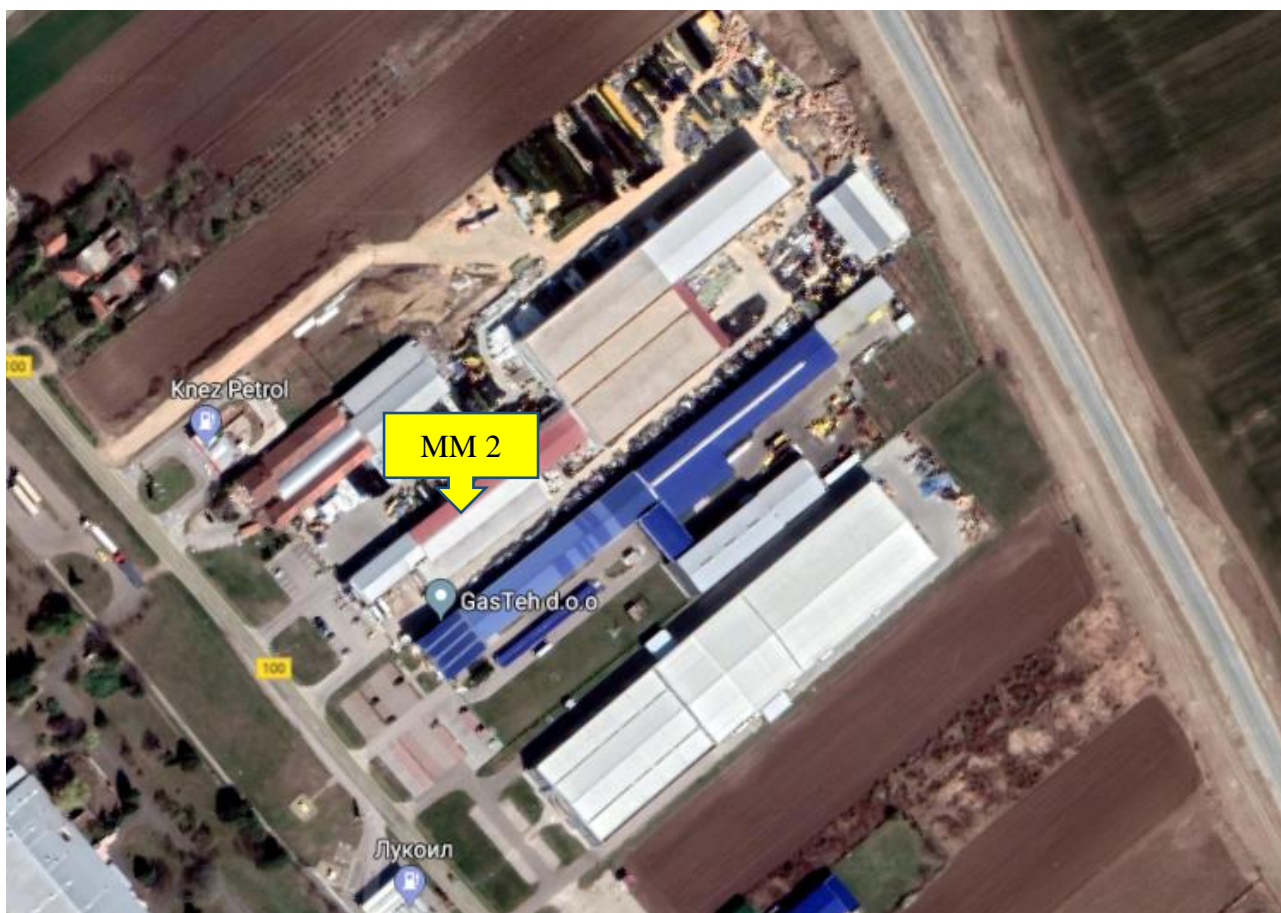
Slika 4. Mikrolokacija MM 2