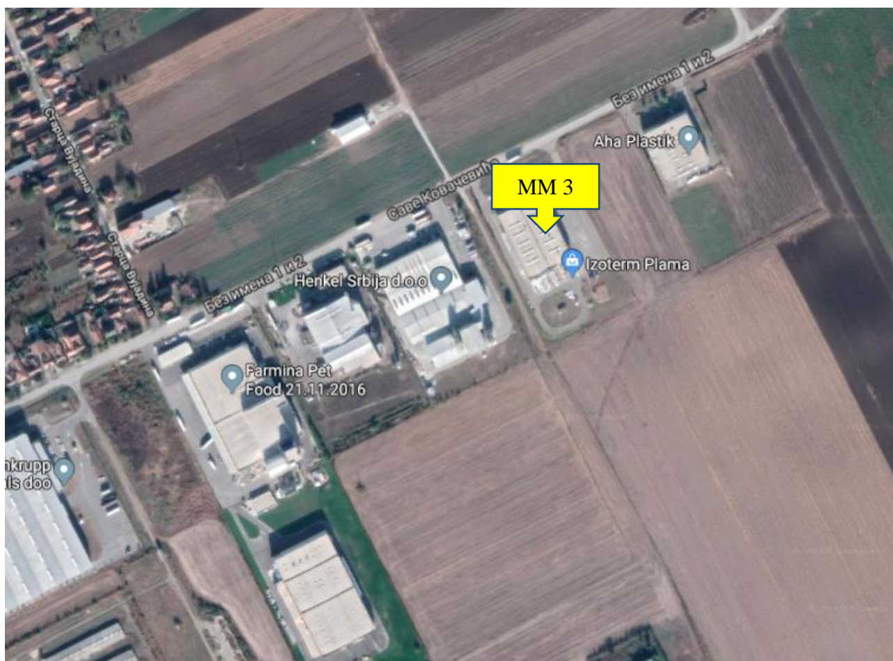
Slika 6. Mikrolokacija MM 3