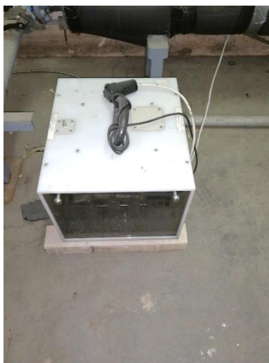
Slika 7. Merno mesto MM 3