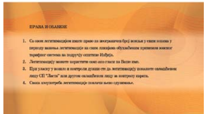
Легитимација за повлашћене категорије