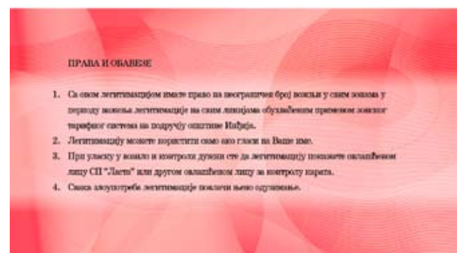
Легитимација за труднице