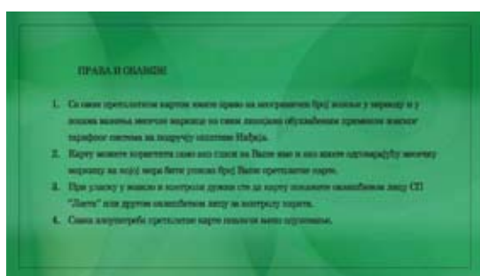
Легитимација за претплатне месечне карте