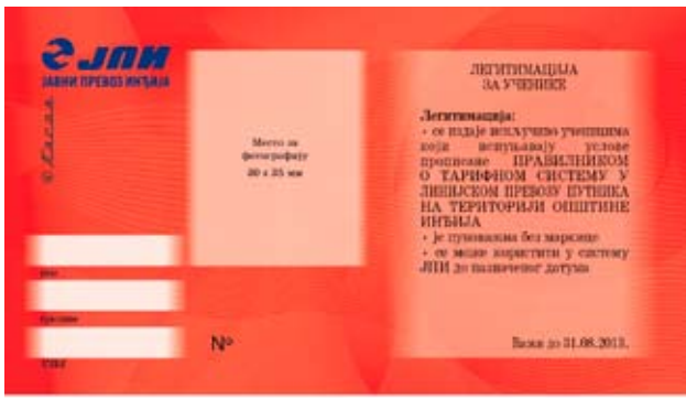
Легитимација за ученике