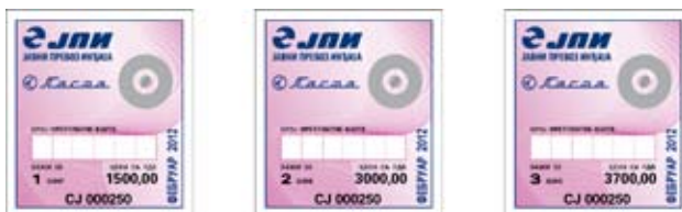
Претплатна месечна маркџца Временске легитимације